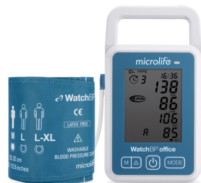
Microlife Watch BP Office 2G

Además, permite medir a pacientes con señales arteriales débiles con el "Modo Auscultatorio". Si se necesita información cardiovascular más completa, el tensiómetro ofrece la tecnología AFIB de Microlife para la detección de la fibrilación auricular, o la opción de medición no invasiva de la tensión arterial central, para evaluar el valor de la tensión arterial de la aorta ascendente.