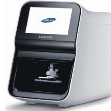
LABGEO PT 10S

Los parámetros se dividen 4 perfiles: Lipid 5, Biochemistry 9, Hepatic 9, Wellness 9.